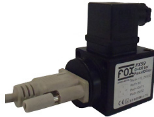
Connessione seriale al pc per l'impostazione dei parametri Serial connection to pc for operative parameters setup

Il pressostato "FX5" permette la regolazione di due soglie di allarme. Il pressostato è fornito di una porta seriale che permette la comunicazione con un computer. Attraverso la connessione seriale è possibile controllare totalmente il pressostato con un software dedicato, con il quale si può impostare da pc due soglie d'intervento con isteresi regolabile, modificare ciascun contatto in NA oppure in NC in funzione dell'applicazione, impostare l'isteresi in modo indipendente e visualizzare l'andamento della pressione in tempo reale sullo schermo. Il sistema di accesso con password inoltre garantisce la massima sicurezza da modifiche inattese dei parametri di funzionamento. I fori passanti permettono il montaggio in ogni posizione e con flangia Cetop. Al termine del setup il tappo di protezione consente di isolare la porta seriale da agenti esterni.