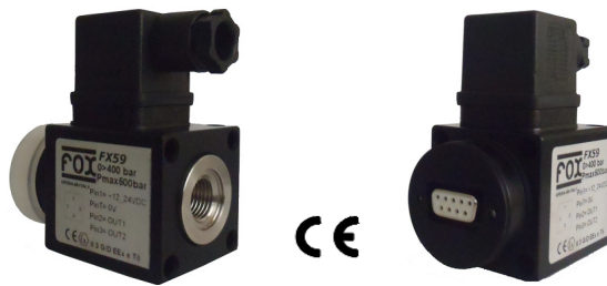
Protezione della porta da agenti esterni Protection of the port from external agents